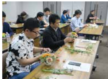
楽しみながらも真剣な表情です