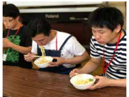
できあがったうどんを美味しくいただきました

さて本題のうどん打ちですが、先生の指導を一生懸命聞いて、みんなにはぐれないよう、上手にできるか緊張しました。しかし基本的に何も考えなくとも指導に従えば完成します。指導者が多いので助かりました。