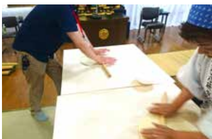
捏ねて伸ばしてうどんを作りました

どう食べるか 何を食べるか 食べたものは 生きること 食べたものの記憶は残ります。 「子どもが育つにはたった一人の親がいればいい。あなたが誰かの一人になればいい」と講演を締めくくられました。