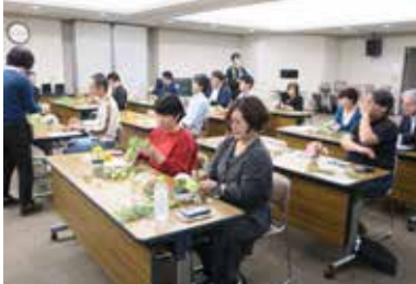
実際に生け花を生けました