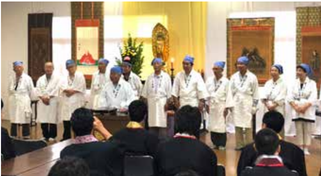
綾川町さぬきうどん研究会の皆さん